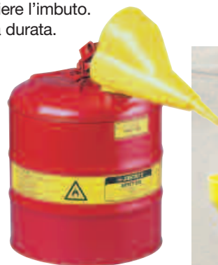
10801 & 11202Y

Per agevolare le operazioni di versamento all'interno di aperture piccole, questo imbuto dal design innovativo ha due posizioni e si fissa ai contenitori di sicurezza in acciaio di tipo I a partire da 4 litri di capacità. L'ampia imboccatura arrotondata dell'imbuto riduce il rischio di schizzi e versamenti. Il polipropilene di lunga durata lo rende resistente agli usi più intensi.