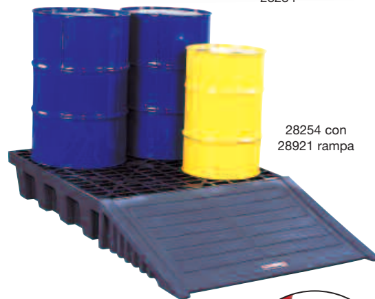
28254 con 28921 rampa