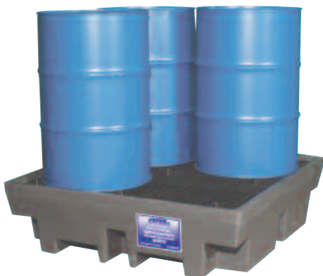
EU28274 con vasca di raccolta grande