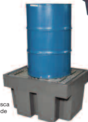
EU28214 con vasca di raccolta grande