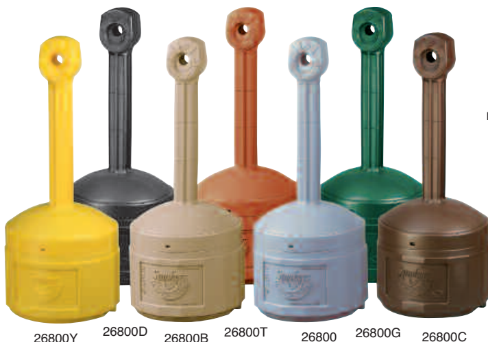
26800Y 26800D 26800B 26800T 26800 26800G 26800C