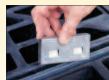
Clip de jonction à installation facile

Avec le kit de vidange Sump-to-Sump™, accrochez des stations de stockage les unes aux autres pour étendre la capacité de vidange et satisfaire aux exigences environnementales locales.